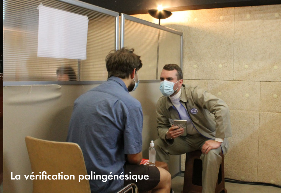
La vérification palingénésique