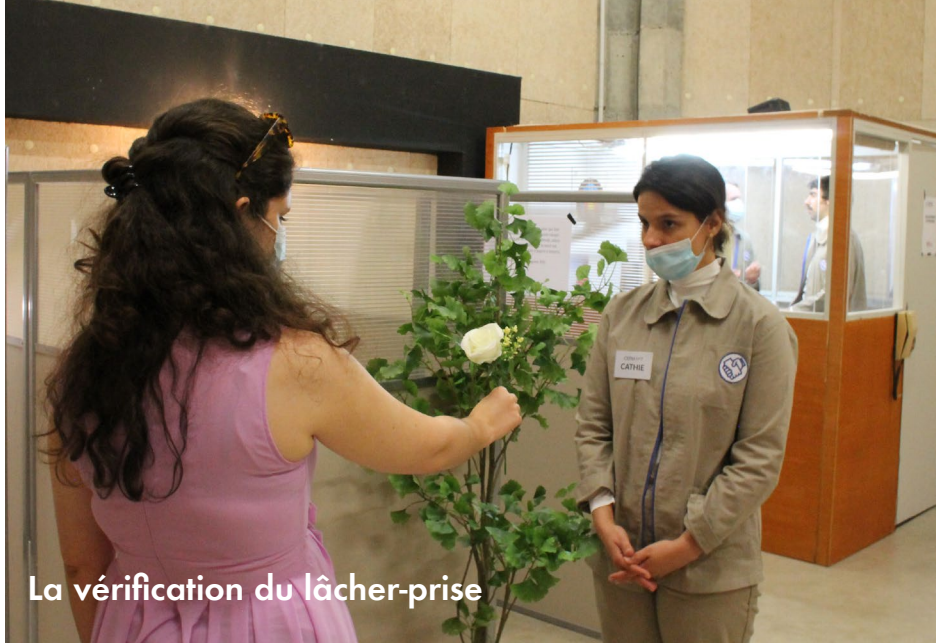
La vérification du lâcher-prise