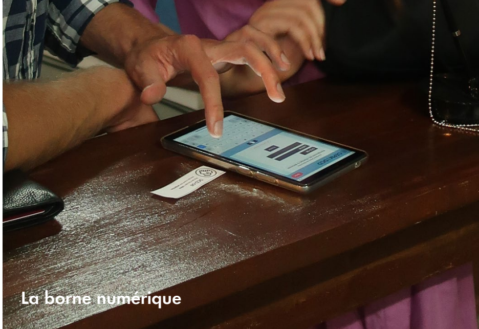
La borne numérique

Certains patientent en zone d'attente, pendant que ceux qui ne l'ont pas fait remplissent leur FIRM aux bornes numériques.»