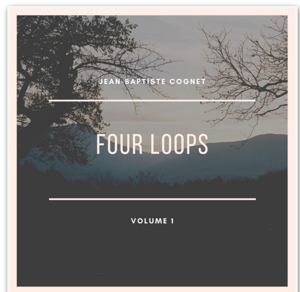
Four Loops Vol. 1 (AoB records, 2021)