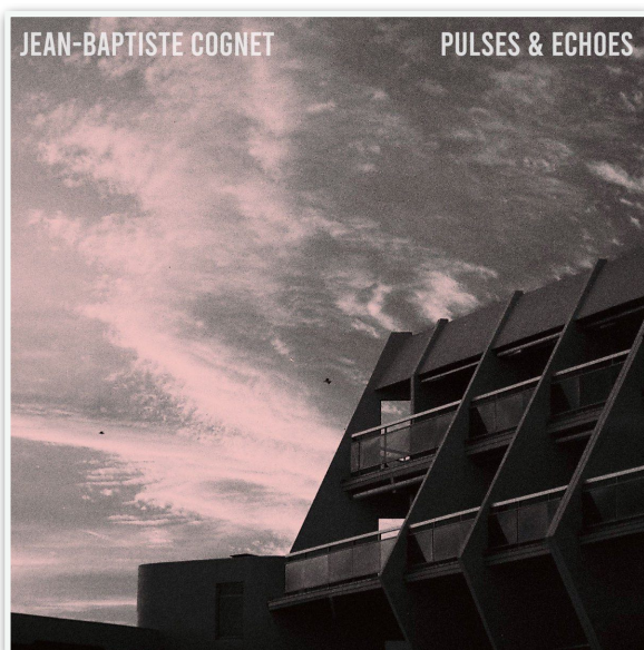
Pulses and Echoes (AoB records, 2020)

Le retour à certaines contraintes dans l'utilisation de machines et d'instruments conçus dans les années 60 ou 70, associées aux technologies numériques actuelles, me permet de prendre le temps de fabriquer la matière, de sculpter les éléments musicaux ou visuels, et de les diffuser dans un temps donné qui correspond à ce que j'ai en tête.