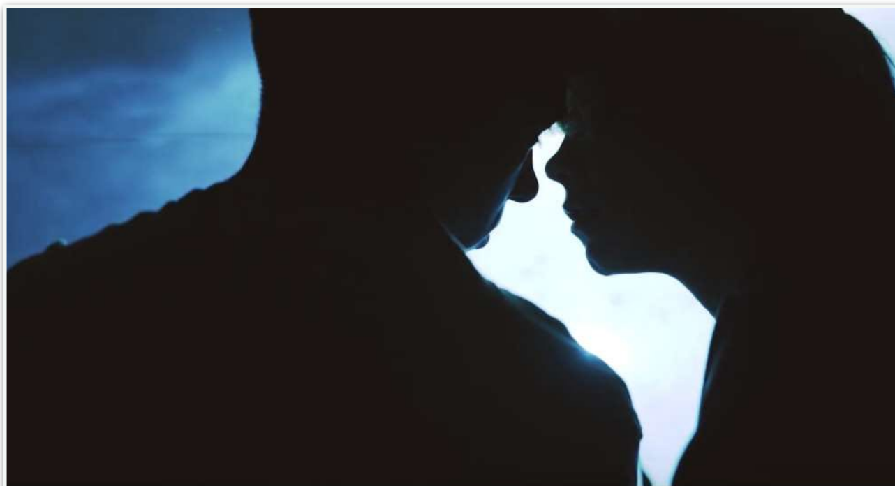
La fin d'Aaron (Florian Bardet, 2019, La Meute productions)

En respectant la tradition des compositeurs du cinéma français de la Nouvelle Vague, j'essaie de mettre en son ce que l'image ne raconte pas, et de créer un sens parallèle à la narration.