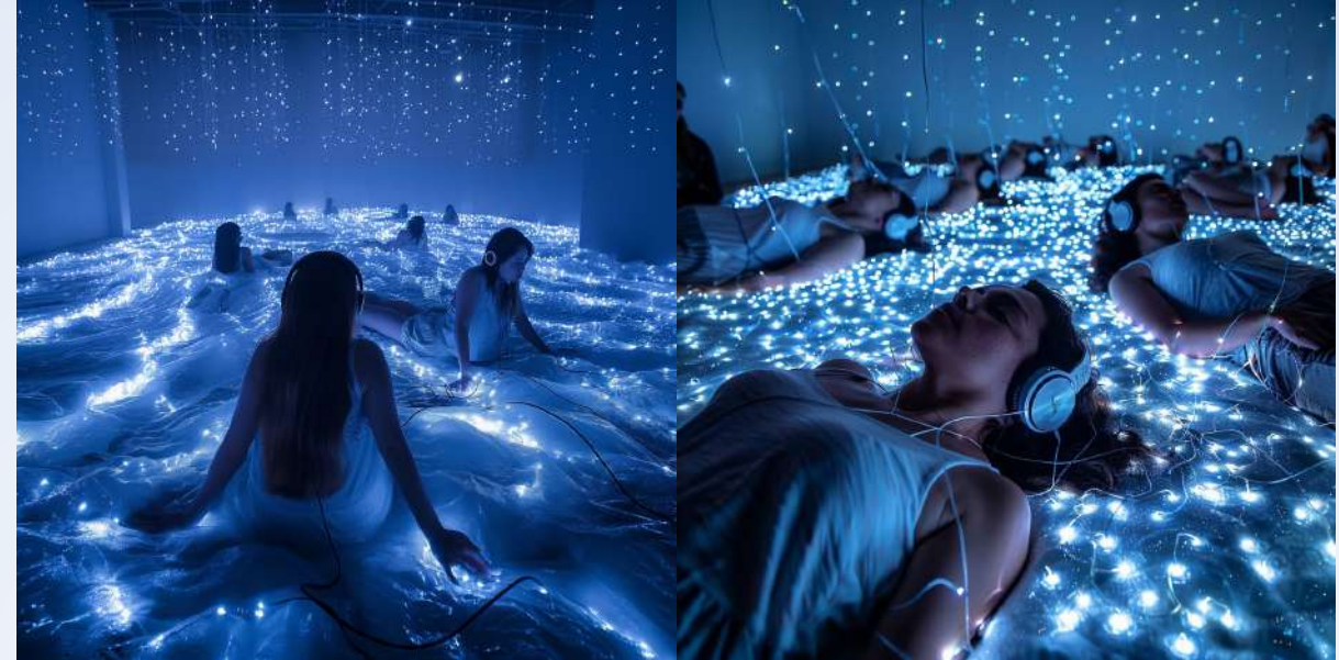
Le Fleuve-Etoile 2024 – 2025 (en développement)

L'Arbre-Soleil est une fiction originale qui vous plonge au cœur d'une forêt enchantée pour vivre un moment unique de régénération d'un arbre millénaire. Les participants y découvrent un nouveau rituel pour faire l'expérience d'un nouveau rapport avec les êtres vivants qui habitent notre monde. Les animaux et les végétaux ont une voix, nous parlent, et nous invitent à refaire corps autour d'un arbre dont l'énergie s'affaiblit.