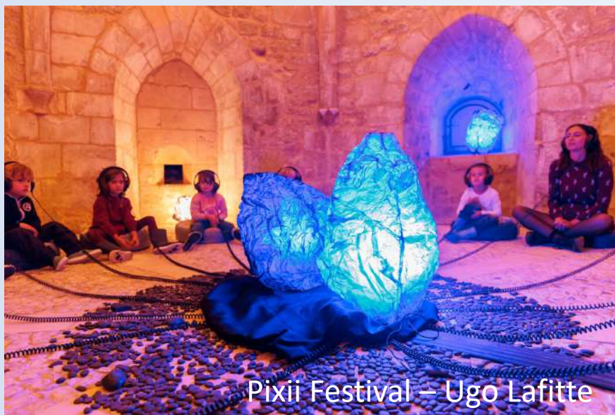
Pixii Festival – Ugo Lafitte