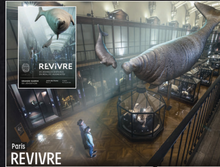
Paris REVIVRE Animaux ressuscités

The attractiveness of augmented reality, the high standards and care taken with the 3D reconstructions of the animals, and the scope of the message conveyed have also met with a large response in the media. This dossier provides a non-exhaustive list.