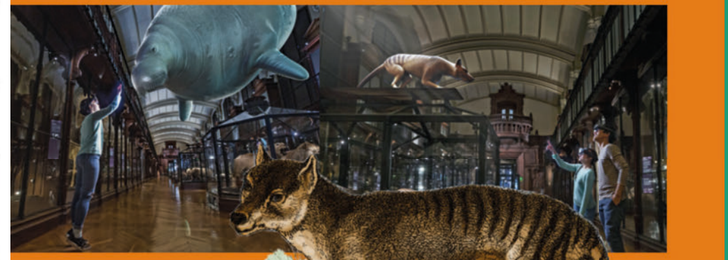
Surprenantes rencontres avec, à gauche, la rhytine de Steller (vache de mer), et à droite, le thylacine (tigre de Tasmanie), représenté ci-contre en 1875.