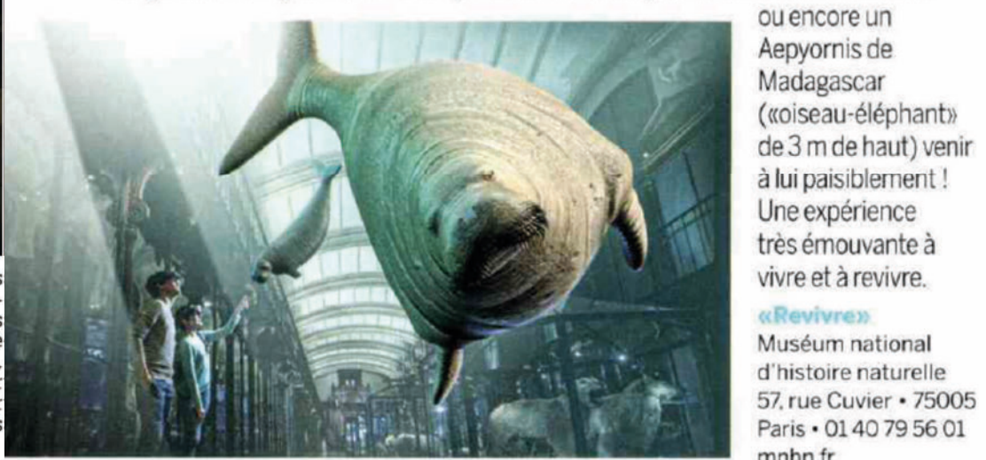
ou encore un Aepyornis de Madagascar («oiseau-éléphant») de 3 m de haut) venir à lui paisiblement ! Une expérience très émouvante à vivre et à revivre.

Nichée dans la Grande Galerie de l'évolution du Muséum national d'histoire naturelle (MNHN), la salle des espèces menacées et disparues – qui recense près de 250 animaux éteints ou en voie d'extinction – redonne vie virtuellement à une dizaine d'entre elles. Grâce à des lunettes de réalité augmentée permettant de voir des images de synthèse se superposer au monde réel, le visiteur aperçoit soudain de gracieuses rhytines de Steller (ou vache des mers), des dodos de l'île Maurice