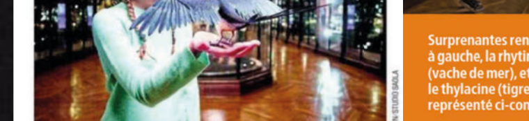
Onze espèces perdues à jamais ont été recréées en réalité augmentée par les équipes du Muséum et le studio Saola.

« Revivre », au Muséum national d'histoire naturelle (V), dès demain. Ouvert les mercredis et week-ends et tous les jours des vacances scolaires. À partir de 8 ans.