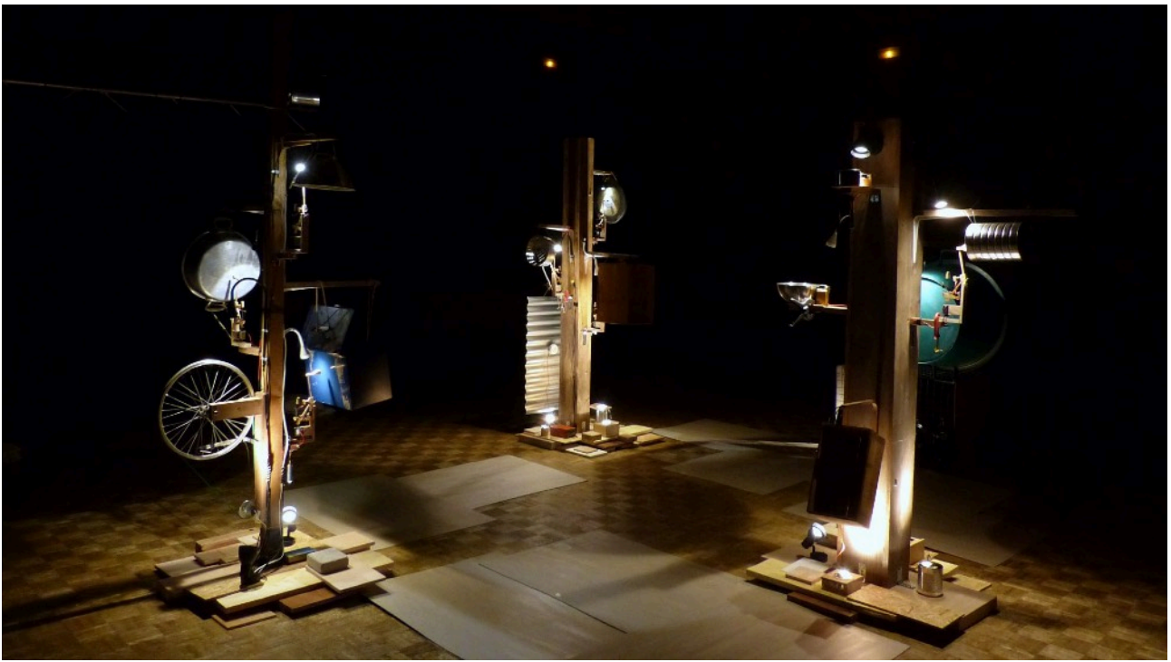
Installation; vue d'ensemble