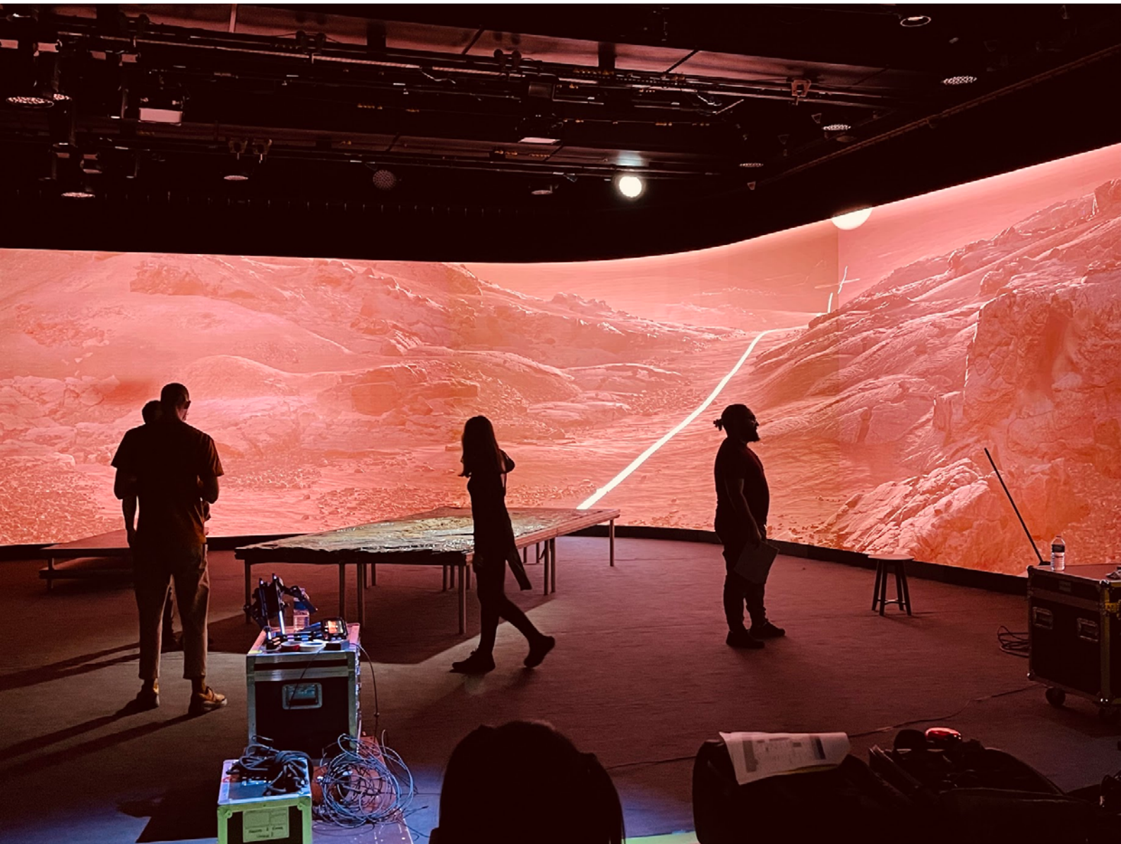
Tournage de Rintsug/i en production virtuelle, scènes Unreal en temps-réel modélisée par ArtFX avec caméra trackée opérée par BigSun. Tourné au studio MVision, Palais des Congrès – Produit par ArtFX avec le soutien de Bizzaroid, BigSun, MVision et le Centre des Arts d'Enghien-Les-Bains