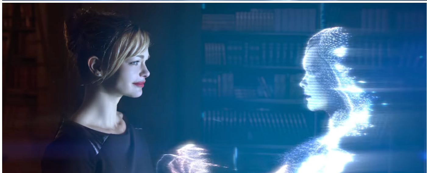
In:Eight , Extraits de film, 5min04, 2016 – Réalisé avec le soutien d'ArtFX.